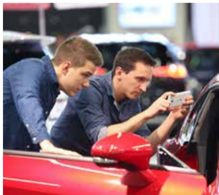
Modellneuheiten und Premieren.