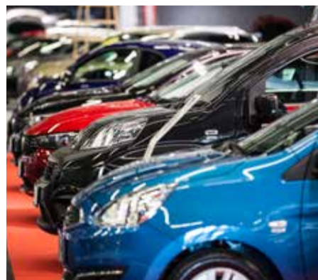
Informationsplattform der Automobilindustrie.